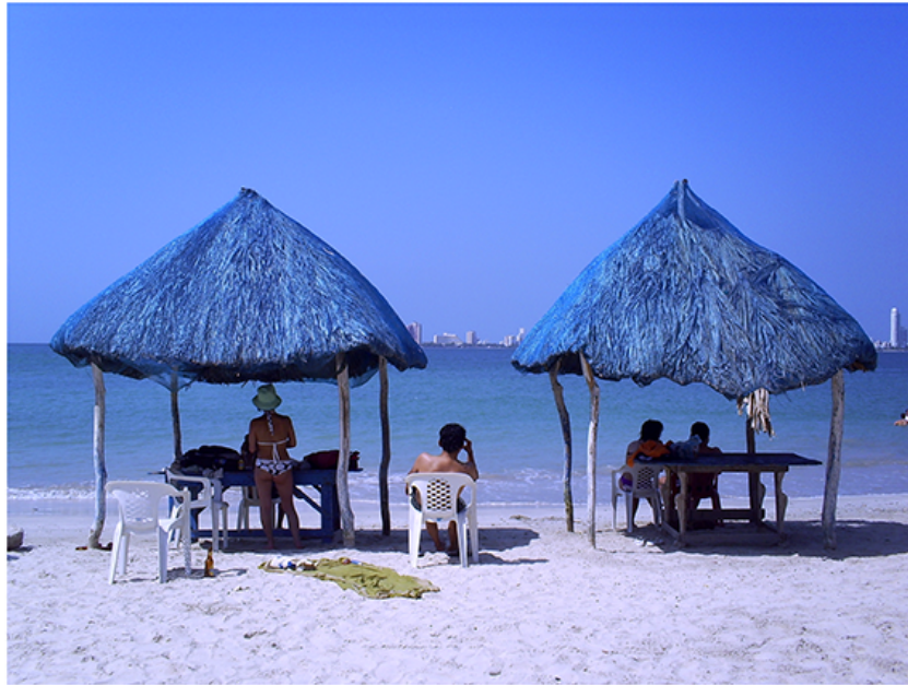
Paisaje Invisible (detalle) Andrés Buitrago (2009).

Instalación con postales envejecidas y afiches usados, dimensiones variables.