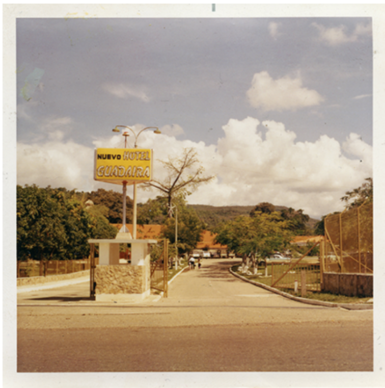
Hotel Guadaira