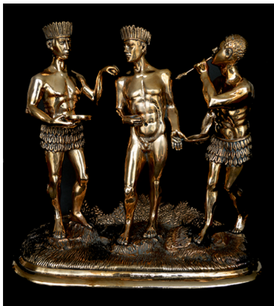
Soplo de Oro de la serie Resplandor Nadin Ospina (2013).