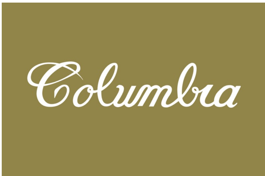
Columbia de la serie El país de los demás Fernando Arias (2012).