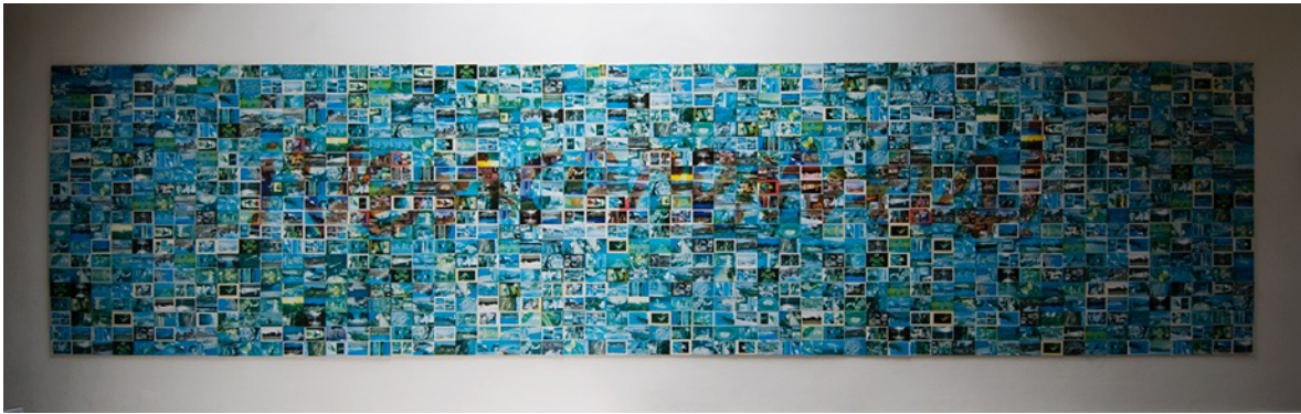
Afección turística (detalle) Juan David Laserna (2010).

Instalación con postales envejecidas y afiches usados, dimensiones variables.